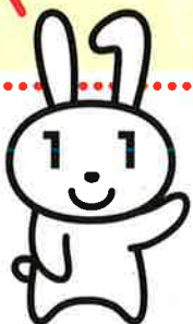
マイナンバーPRキャラクター マイナちゃん