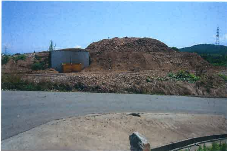
伐採木・草木などの堆積場