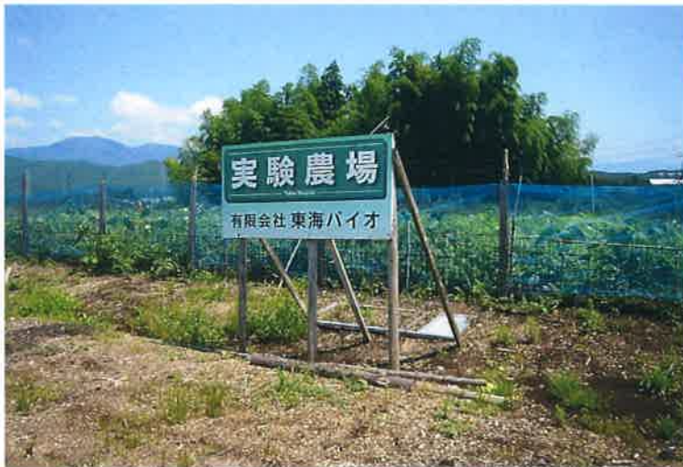
有機肥料を使用した実験農場