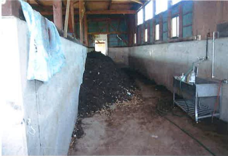
処理施設 バイオ菌を攪拌させて発酵させる