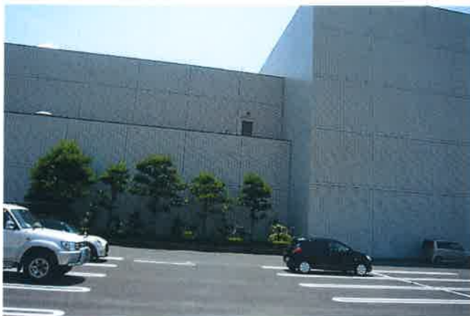
恵那文化センター