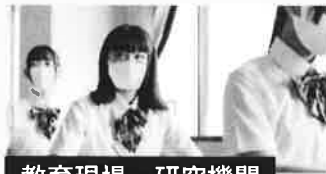
教育現場・研究機関

お客様訪問がある接客クルーやどうしても出社せざるを得ない職場でも、安心して働けることを目指します。