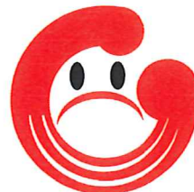
公益財団法人 岐阜県暴力追放推進センター