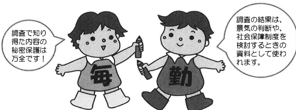
毎月勤労統計調査のキャラクター「まいちゃん きんちゃん」

調査対象に選ばれた事業所の皆さまには、 調査へのご理解とご回答をお願いいたします。